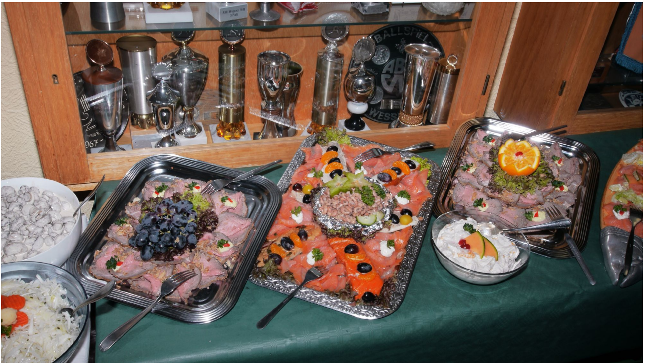
Ein kleiner Teil des Büffets