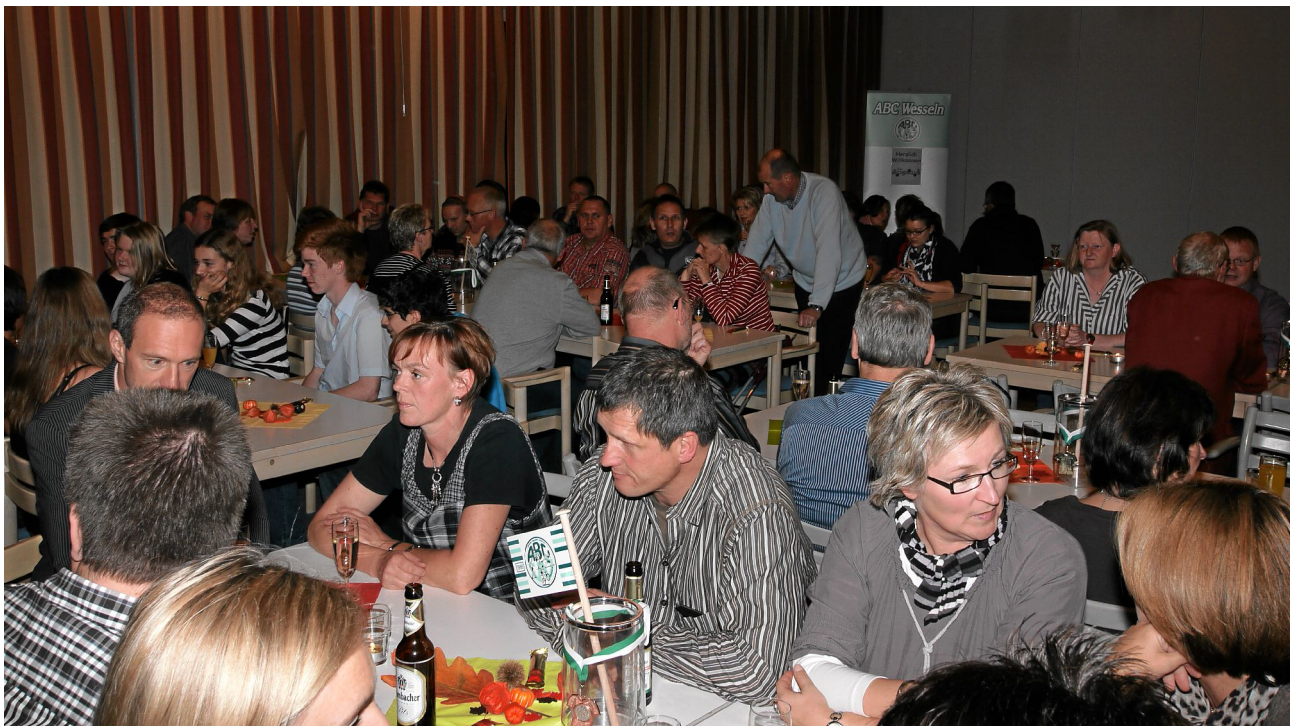
Blick in den Saal